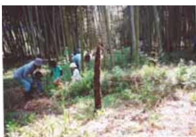
～ タケノコ掘り体験～

私たちの地区も、10戸余りの空き家があります。これからの地区の将来に向けて、「どうすればよいだろうか」との思いでいっぱいです。皆さんも、機会をとらえて是非とも天尾地区に足を運んでください。移住応援団として、みんなで待っています。