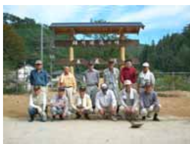
～ 完成した錦川源流の碑～