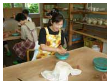
～ 陶芸教室の受講生たち～