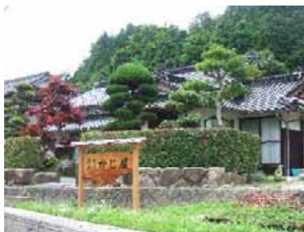
～ かじ屋看板 ～