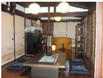
～ 囲炉裏 ～