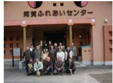
阿賀ふれあいセンター前で記念撮影