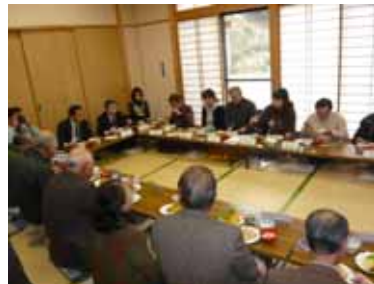
炊きこみご飯などで昼食会