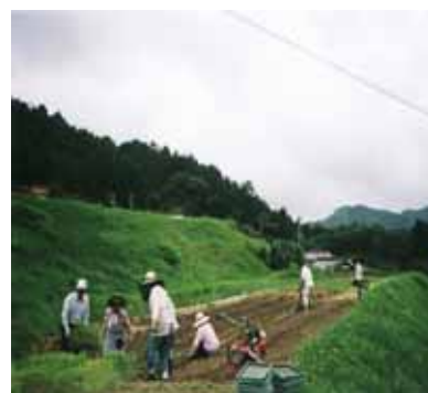
～ 薬草植え付け風景 ～