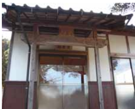
～ 観音堂 ～

農業面では、米づくりを主体に、今年度から、薬草(カワラケツメイ)や、らっきょう栽培に取り組みます。10月には栗拾い体験の受け入れを計画しており、将来的には縁側カフェも検討中です。今後、瀬戸ノ内集落に多くの方にお越しいただき、住みたくなる瀬戸ノ内集落のファンづくりをすすめようと思っています。