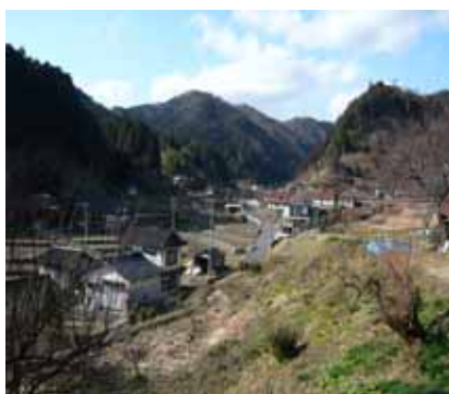
～ 瀬戸ノ内地区全景 ～