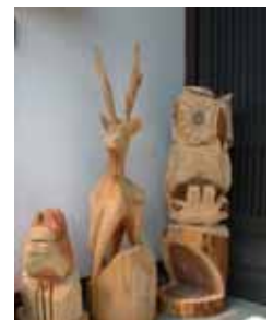
チェーンソーアート

『作って見れば、イメージ通りには行かないこともあるけれど、仲間といっしょにやってみるのも楽しいですよ。』とお話してくれました。