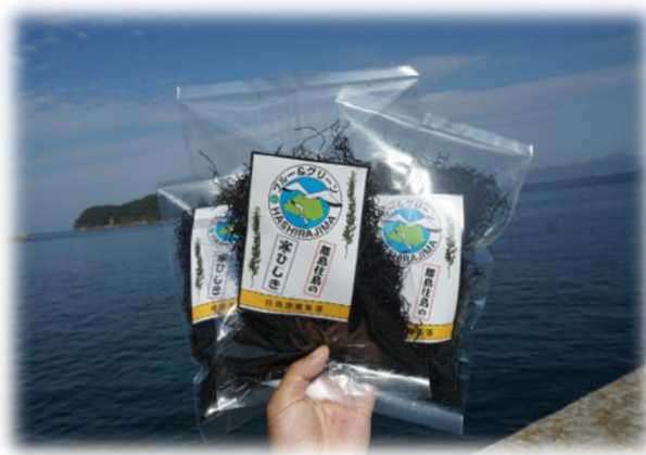
『岩国市漁業協同組合柱島支店』